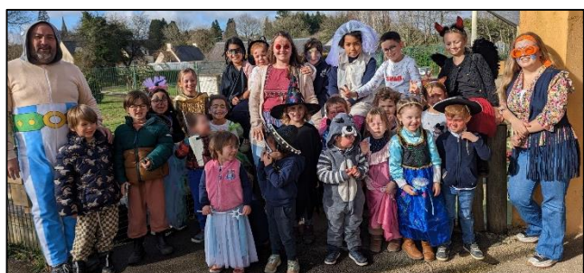
Photo souvenir de notre « jeudi gras », jour de fête costumée, musicale et gourmande !

Ce sera aussi l'occasion de faire vivre aux enfants des animations autour de l'alimentation dans le cadre d'initiatives autour de la parentalité dans les monts d'Arrée. Encore plein de beaux moments à vivre avec l'équipe d'animation au centre de loisirs !