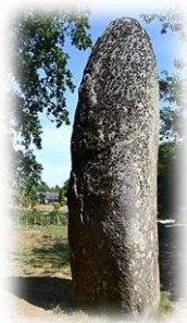
The huge standing stone in Kerampeulven.

Dolmens: In Breton this means ( dol ) table and ( men ) stone. Is a basic structure of a Neolithic burial chamber, with supporting uprights and a large capstone as a roof. They began as simple passage graves, as an entrance to a burial chamber. The size of the dolmen suggests they were for important figures.