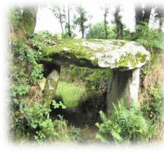
The dolmen near Quinoualc'h, the remains of a burial chamber.

Most people know of Stonehenge, a circular megalithic monument in Wiltshire, but this does not compare to the dozens of man-made monuments in the north-west of France, dating between 4800 BC and 3500 BC.